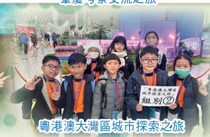
粵港澳大灣區城市探索之旅