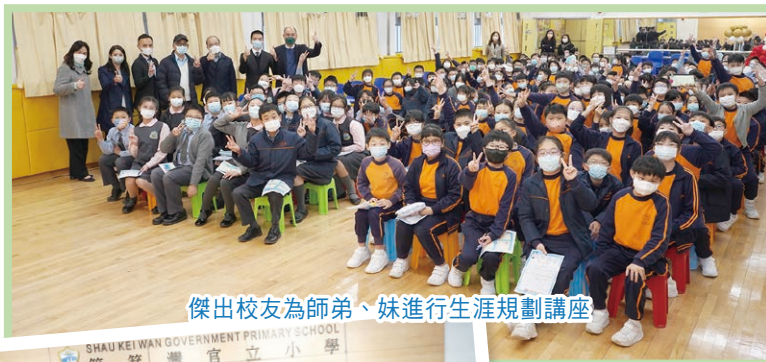
傑出校友為師弟、妹進行生涯規劃講座