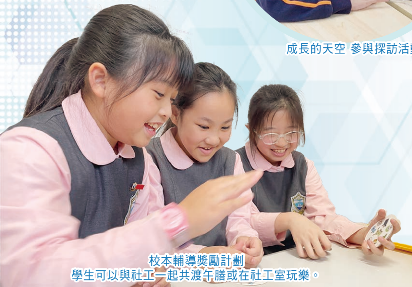
校本輔導獎勵計劃 學生可以與社工一起共渡午膳或在社工室玩樂。