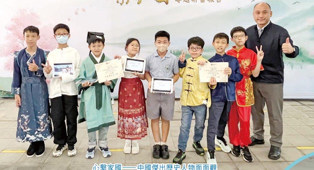
心繫家園——中國傑出歷史人物面面觀