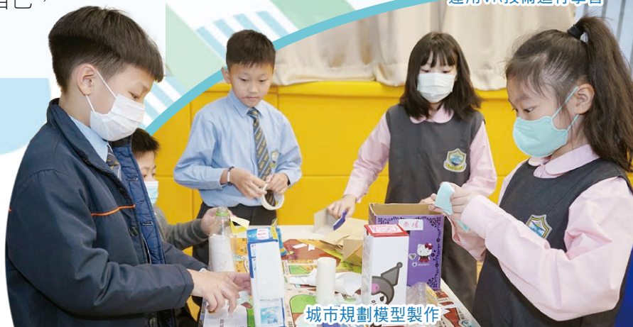
城市規劃模型製作