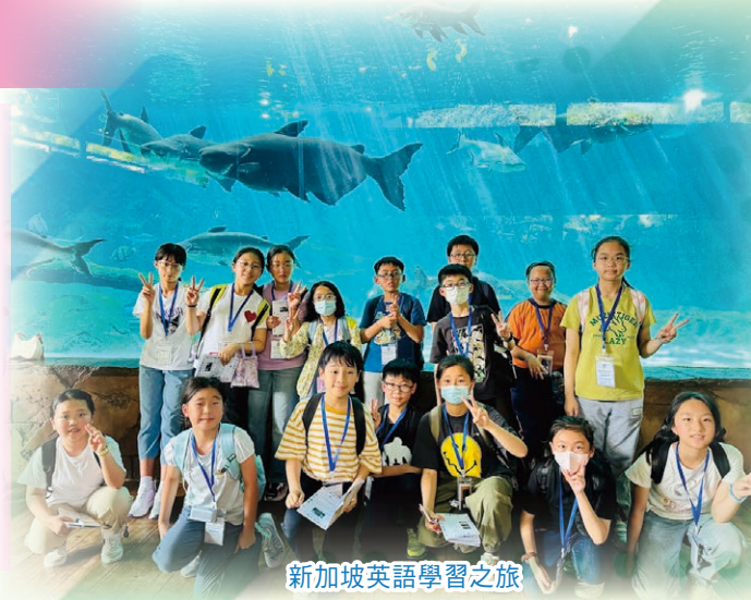
新加坡英語學習之旅

本校重視學生的體驗學習，為學生安排到訪不同的地區，認識當地的文化，並與當地的學生交流。學生透過活動，既能鞏固課堂學習，同時可開拓視野，更能提升自理能力及團隊精神。