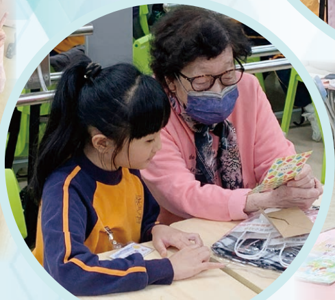
成長的天空 參與探訪活動