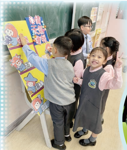
心情天氣匯報活動

本校重視培養學生的正向思維，透過多元化的學習活動及服務機會，幫助他們提升正向情緒及建立正向的品格，從而活出有意義及健康的人生。