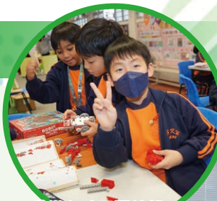
「樂在社區閱讀紛 『喜』動圖書館」

本校一直重視閱讀，校內有良好的閱讀氣氛。透過不同類型的閱讀活動，提升學生閱讀的興趣，發展學生不同的能力。另外，學生參與閱讀活動及比賽，增加投入感及學習動力，養成閱讀的習慣，從而提升學生自主學習的能力。