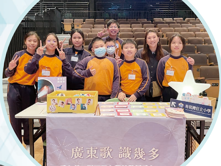
愛心義工隊不單在學校散播愛心， 亦把愛心散播到筲箕灣社區。