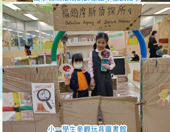
小一學生參觀玩具圖書館