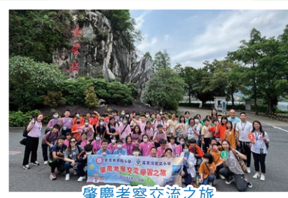
肇慶考察交流之旅