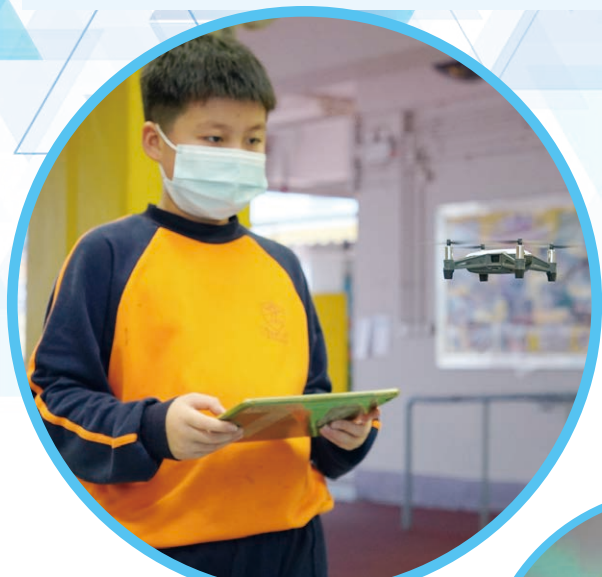
航拍精英培訓課程

本校積極發展STEAM教育，透過推動多元的創科活動，學生應用STEAM知識於學習環境及生活中，啟發探究、創造及解難能力。