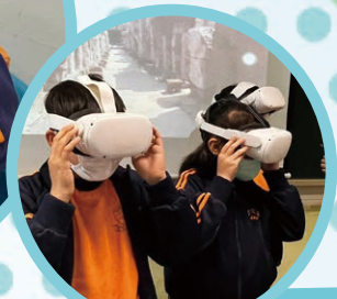
運用VR技術進行學習