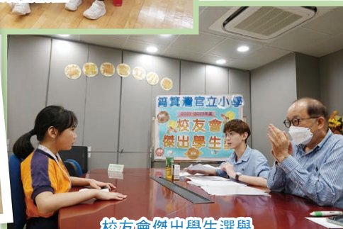
校友會傑出學生選舉