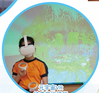
元宇宙VR 繪畫藝術課程