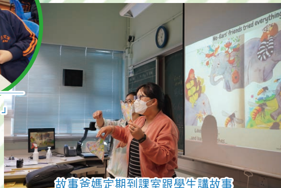
故事爸媽定期到課室跟學生講故事