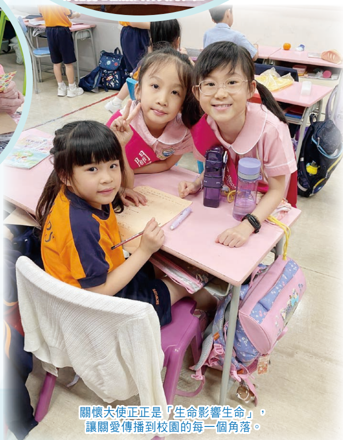
關懷大使正正是「生命影響生命」， 讓關愛傳播到校園的每一個角落。