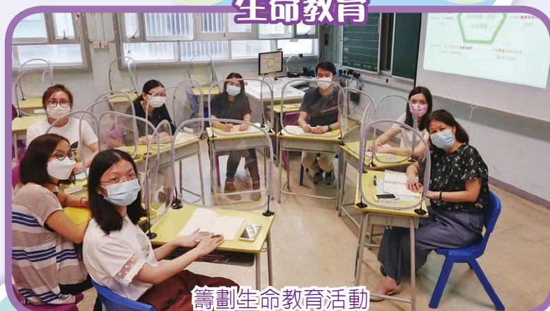
籌劃生命教育活動